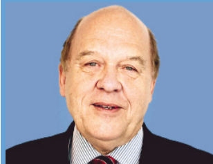
Von Klaus J. Stöhlker

Fahre ich durch unsere Dörfer und kleinen Städte, die derzeit, wie Stäfa, schrecklich umgegraben werden – aber der Fortschritt will sein Recht – dann sehe ich sauber geschnittene Hecken, wo jede Spitze auffällt, die nicht den Prinzipien der richtigen Ordnung folgt. Hinter diesen Hecken wohnen Menschen in grossen Häusern, die kleine Autos fahren, um die Nachbarn nicht noch neidischer zu machen, oder Menschen in kleinen Wohnungen, die grosse Autos fahren, weil das Haus keine Option ist.